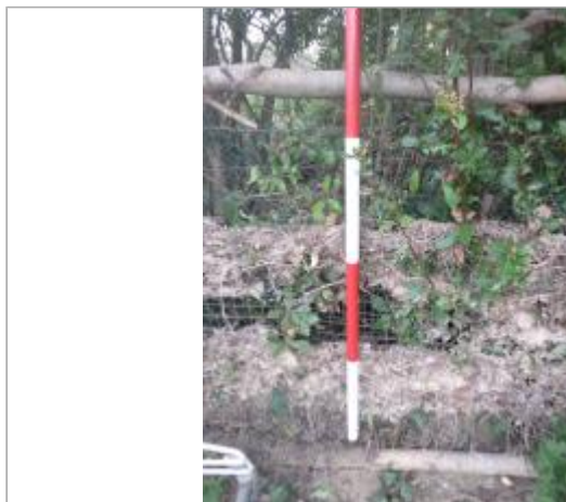
Berge rive gauche jardin - Photo ©AGERIN

Coordonnées WGS84 : X: 2.35449081 / Y: 43.18420640