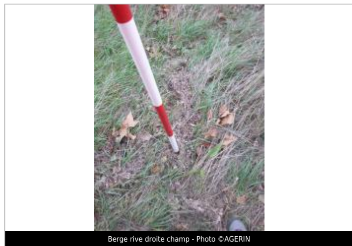
Berge rive droite champ