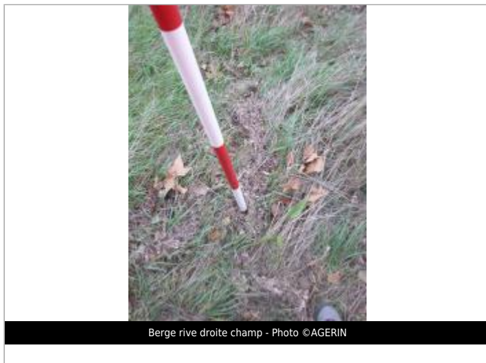
Berge rive droite champ