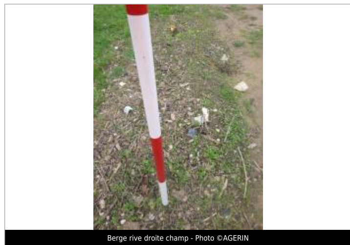
Berge rive droite champ