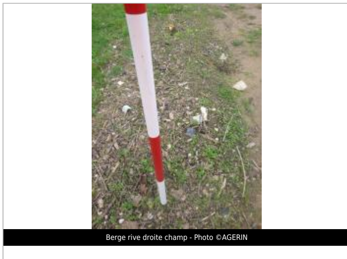
Berge rive droite champ