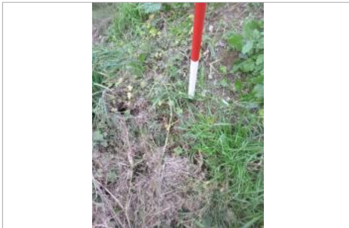
Berge rive droite digue