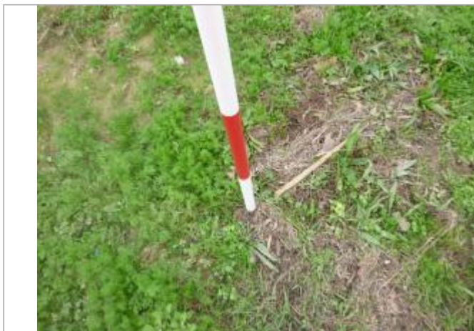
Berge rive droite