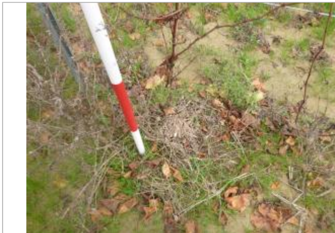
Berge rive gauche

Coordonnées WGS84 : X: 2.37217365 / Y: 43.18082750