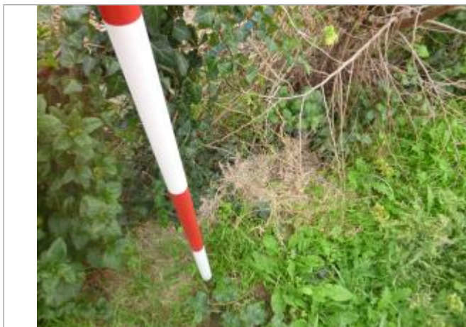
Berge rive droite champ

Coordonnées RGF93 (ETRS89) : X: 2.3700132 / Y: 43.1820838