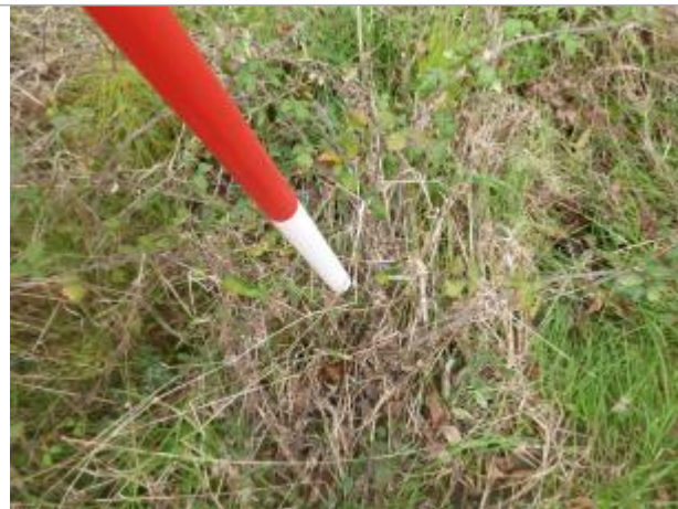
Berge rive droite champ

Coordonnées WGS84 : X: 2.36883201 / Y: 43.18207020