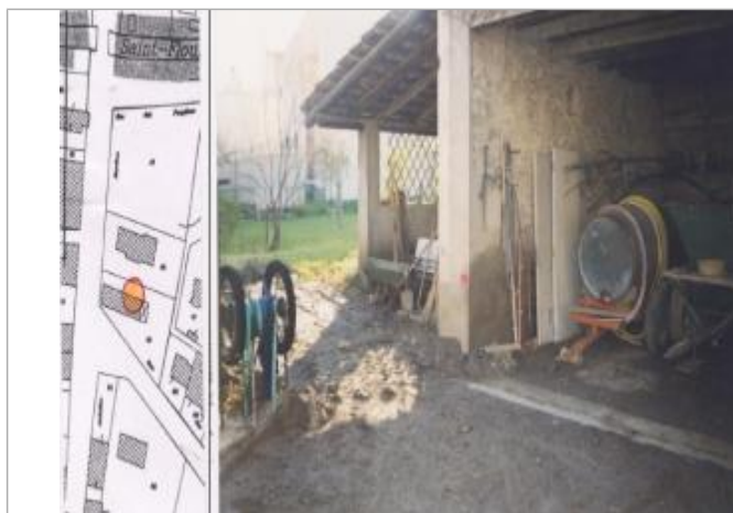
Berge rive gauche