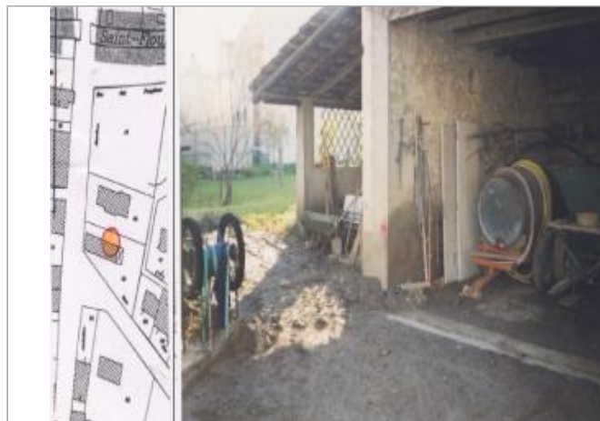
Berge rive gauche

Coordonnées RGF93 (ETRS89) : X: 2.3673657 / Y: 43.1826648