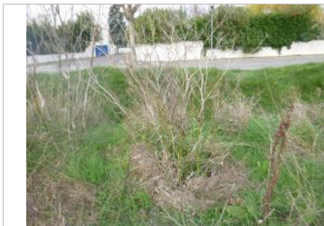
Berge rive gauche champ