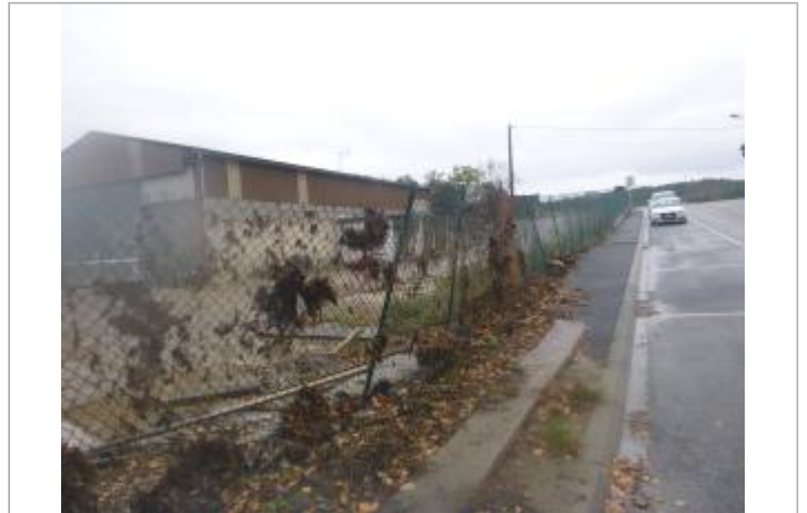
Berge rive droite