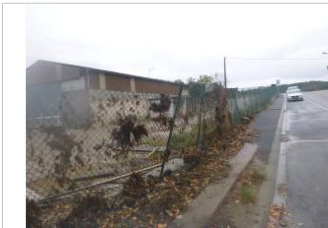
Berge rive droite

Altitude calculée de l'eau (en m) : 151.72 m