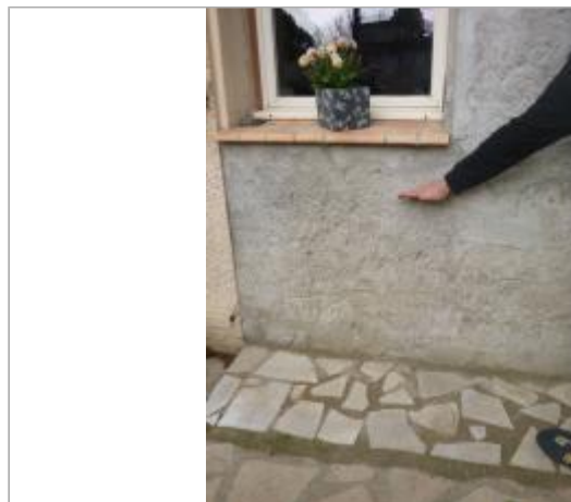
Berge rive droite

Coordonnées RGF93 (ETRS89) : X: 2.3823968 / Y: 43.173941