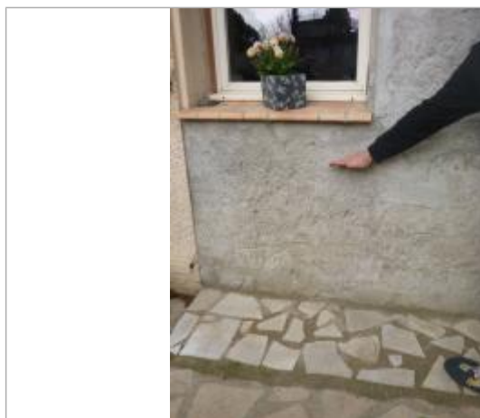
Berge rive droite