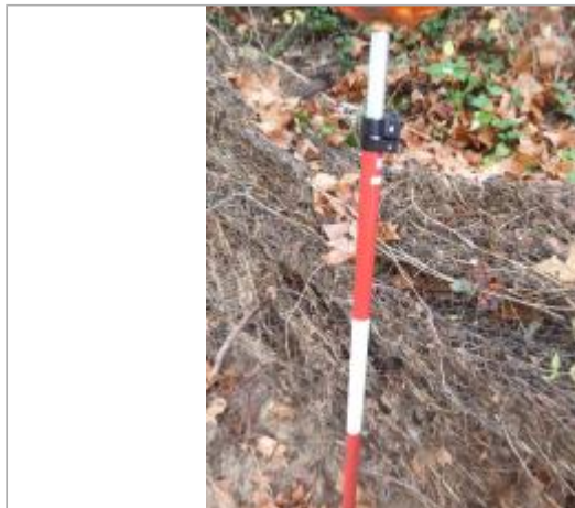
Berge rive gauche

Coordonnées WGS84 : X: 2.38254371 / Y: 43.17358070