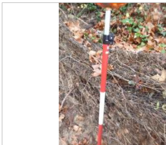
Berge rive gauche