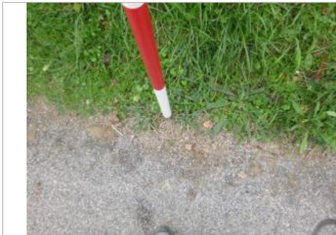
Berge rive droite

Coordonnées WGS84 : X: 2.32120345 / Y: 43.14974110