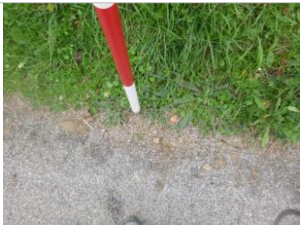
Berge rive droite

Altitude calculée de l'eau (en m) : 134.21 m