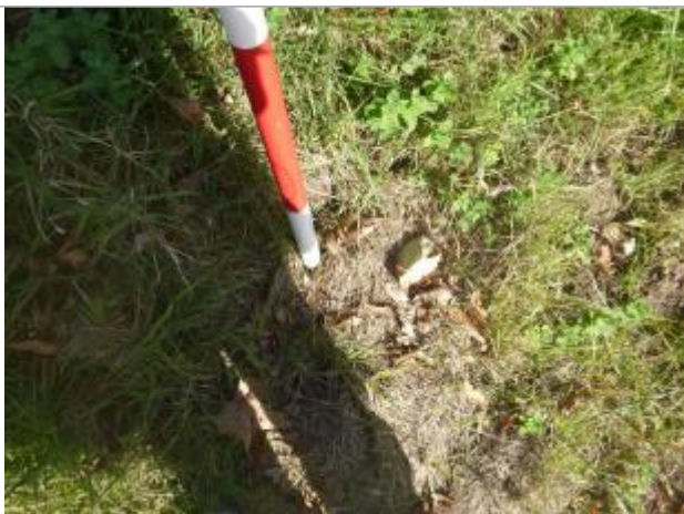
Berge rive droite champ

Altitude calculée de l'eau (en m) : 167.64 m