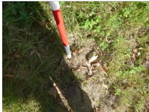
Berge rive droite champ

Coordonnées WGS84 : X: 2.31361515 / Y: 43.09210820