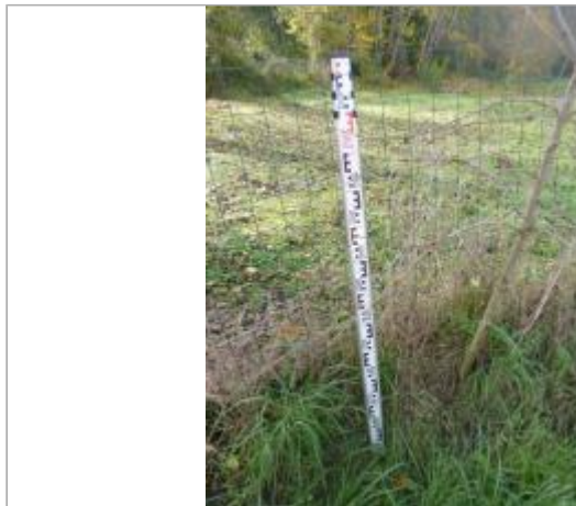
Berge rive gauche