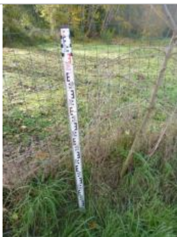
Berge rive gauche