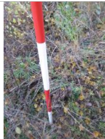
Berge rive gauche champ