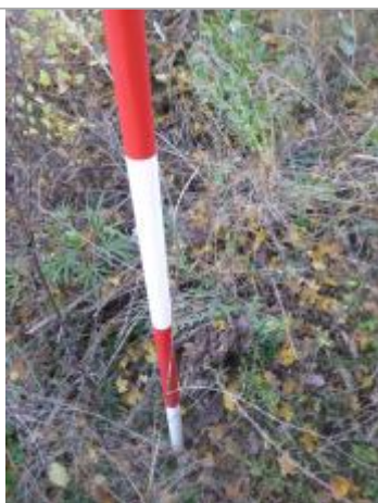
Berge rive gauche champ