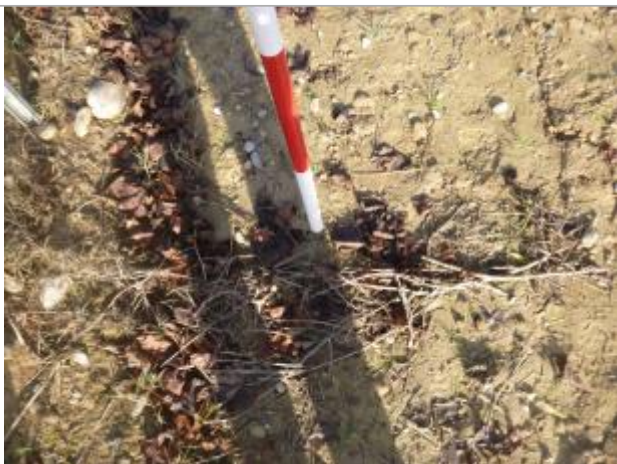
Berge rive gauche

Altitude calculée de l'eau (en m) : 157.79 m