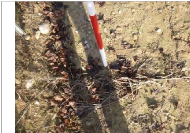
Berge rive gauche