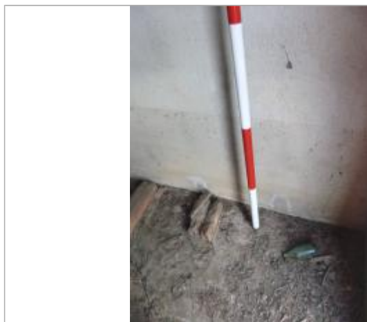
Berge rive droite vigne

Altitude calculée de l'eau (en m) : 153.2 m