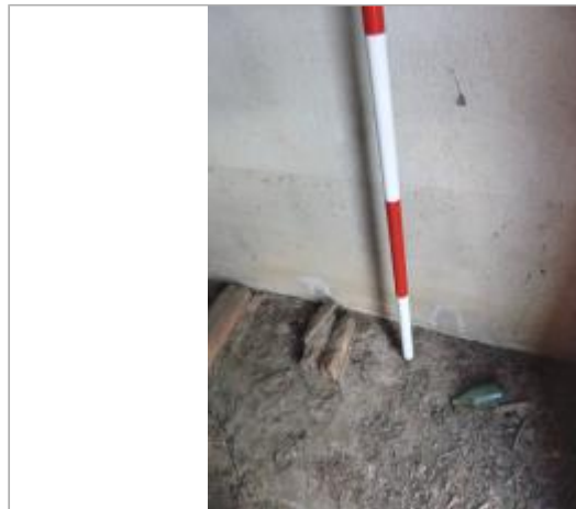
Berge rive droite vigne

Coordonnées WGS84 : X: 2.23197849 / Y: 43.09379560