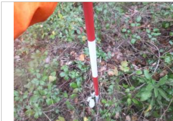
Berge rive gauche forêt

GÉOLOCALISATION Coordonnées WGS84 : X: 2.26128058 / Y: 42.98981540 Coordonnées RGF93 (Lambert 93) X: 639700.57 / Y: 6210333.32 Coordonnées RGF93 (ETRS89) : X: 2.2612806 / Y: 42.9898154 Code Hydro: Y1--0200 Rive de référence: Gauche