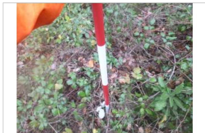
Berge rive gauche forêt

GÉNÉRAL Code : AGERIN2018_R_102_1 Date de mise à jour : 09/01/2020 Auteur : SPC MO