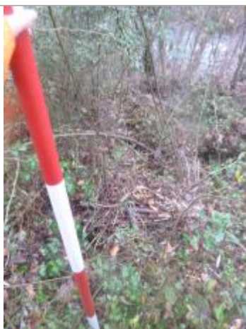
Berge rive gauche forêt