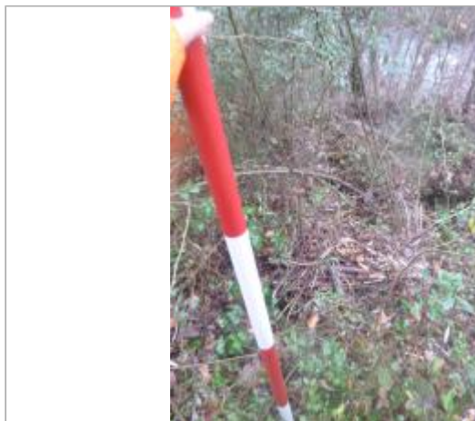
Berge rive gauche forêt