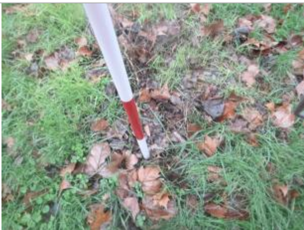
Berge rive droite amont

Altitude calculée de l'eau (en m) : 204.45 m