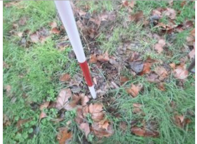
Berge rive droite amont