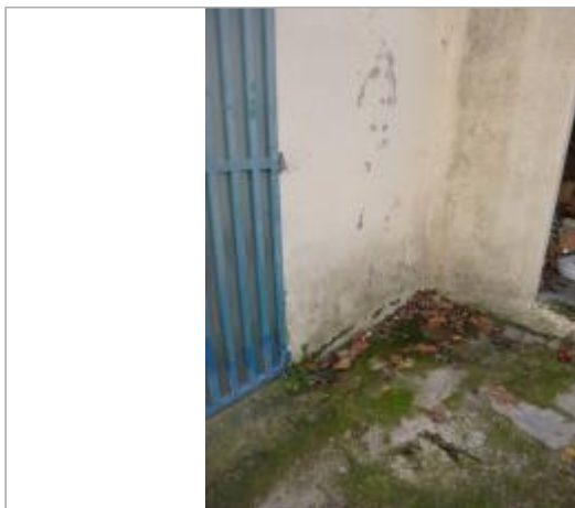
Berge rive droite amont

Coordonnées WGS84 : X: 2.26189895 / Y: 42.99071050