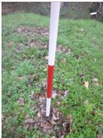
Berge rive droite amont