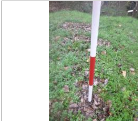
Berge rive droite amont

Coordonnées WGS84 : X: 2.26172765 / Y: 42.99071380