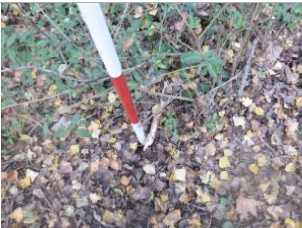
Berge rive gauche forêt

Altitude calculée de l'eau (en m) : 203.59 m