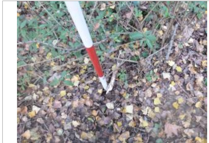
Berge rive gauche forêt

Coordonnées WGS84 : X: 2.25925585 / Y: 42.99171170