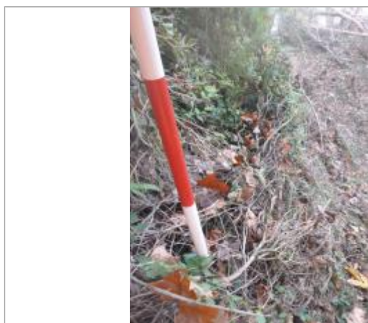
Berge rive gauche forêt amont

Altitude calculée de l'eau (en m) : 199.58 m