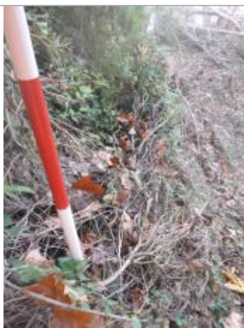
Berge rive gauche forêt amont