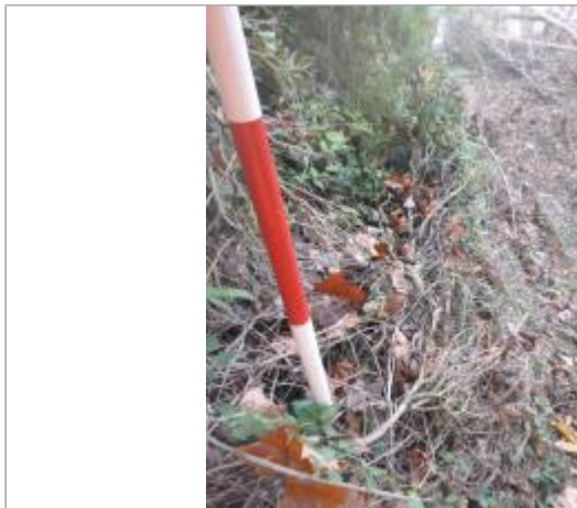
Berge rive gauche forêt amont