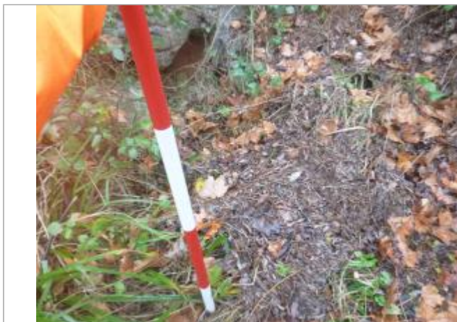
Berge rive gauche forêt aval