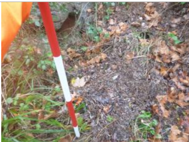
Berge rive gauche forêt aval - Photo ©AGERIN

Altitude calculée de l'eau (en m) : 197.48 m