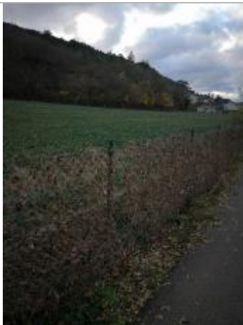
Berge rive gauche

Altitude calculée de l'eau (en m) : 229.16 m