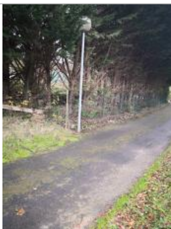
Berge rive droite