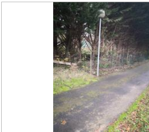
Berge rive droite

Coordonnées WGS84 : X: 2.31917354 / Y: 42.91711700