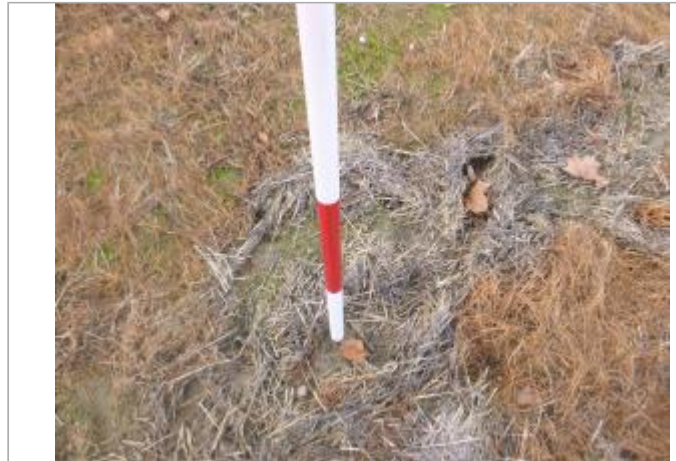
Berge rive gauche champ

Coordonnées WGS84 : X: 2.29555741 / Y: 43.19271510