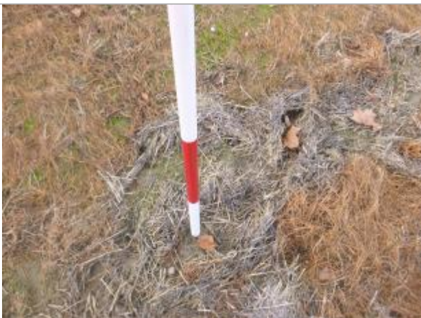
Berge rive gauche champ

Altitude calculée de l'eau (en m) : 129.28