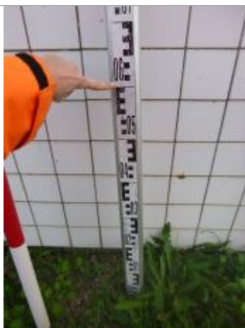
Berge rive gauche stade

Altitude calculée de l'eau (en m) : 119.59