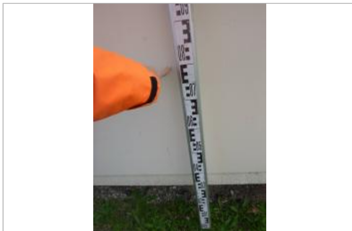
Berge rive gauche stade

Coordonnées WGS84 : X: 2.31202807 / Y: 43.19014900