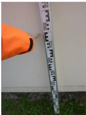
Berge rive gauche stade

Altitude calculée de l'eau (en m) : 119.58