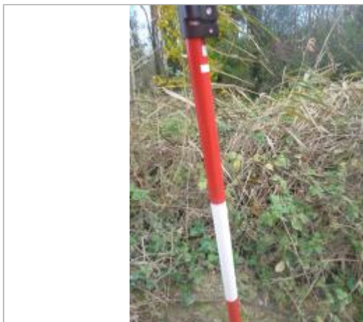
Berge rive droite

Coordonnées WGS84 : X: 2.32658467 / Y: 43.18572660