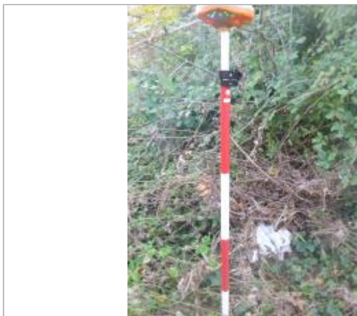
Berge rive droite sous le pont

Coordonnées WGS84 : X: 2.33314850 / Y: 43.19517220