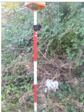
Berge rive droite sous le pont - Photo ©AGERIN