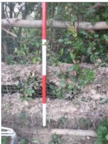
Berge rive gauche jardin