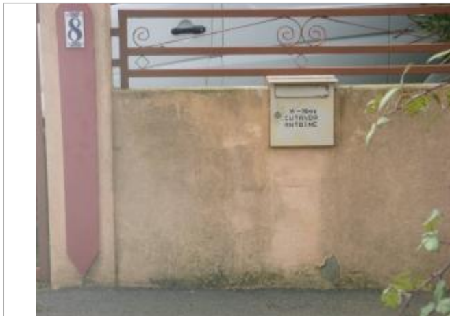
Berge rive droite