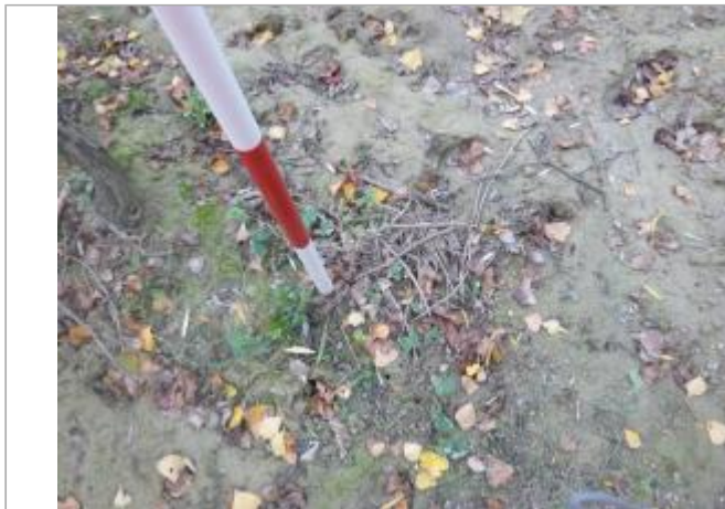
Berge rive gauche - Photo ©AGERIN

Coordonnées WGS84 : X: 2.36876163 / Y: 43.18140680