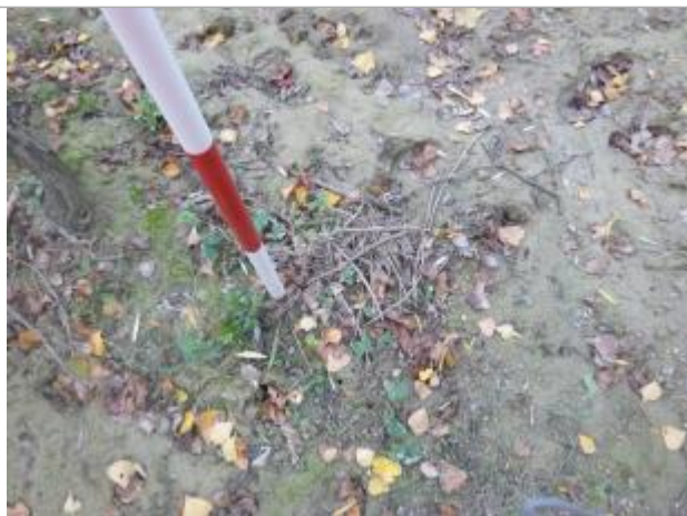
Berge rive gauche

Altitude calculée de l'eau (en m) : 138.82