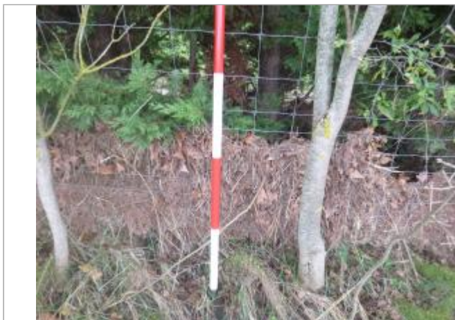
Berge rive droite champ - Photo ©AGERIN

Coordonnées RGF93 (ETRS89) : X: 2.3696778 / Y: 43.1817182