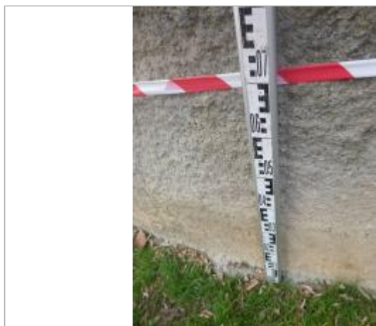
Berge rive droite