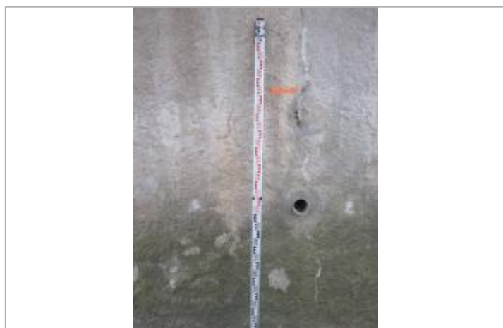
Berge rive droite