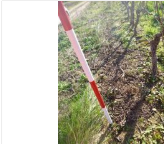
Berge rive gauche vigne

Coordonnées WGS84 : X: 2.31624469 / Y: 43.15091760