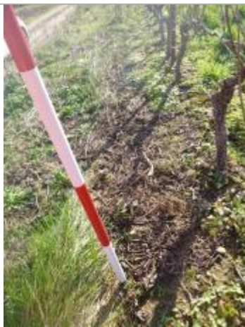
Berge rive gauche vigne