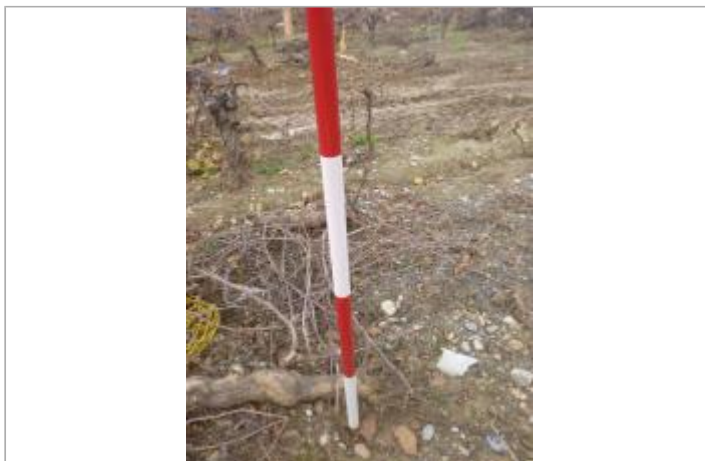
Berge rive gauche vigne

Coordonnées WGS84 : X: 2.32223515 / Y: 43.14273200