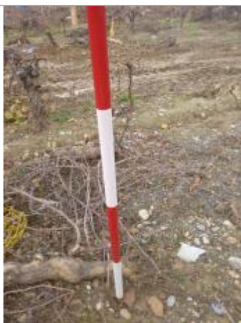
Berge rive gauche vigne - Photo ©AGERIN

Altitude calculée de l'eau (en m) : 134.62