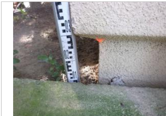
Berge rive droite - Photo ©AGERIN

Coordonnées WGS84 : X: 2.30805989 / Y: 43.09843120