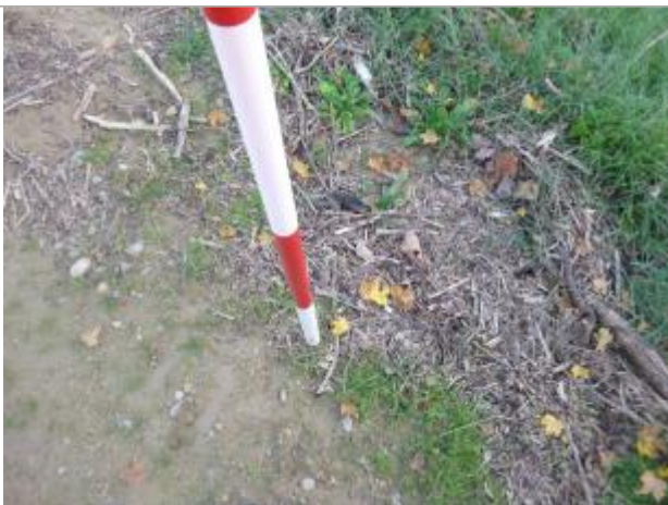
Berge rive gauche vigne

Altitude calculée de l'eau (en m) : 161.03