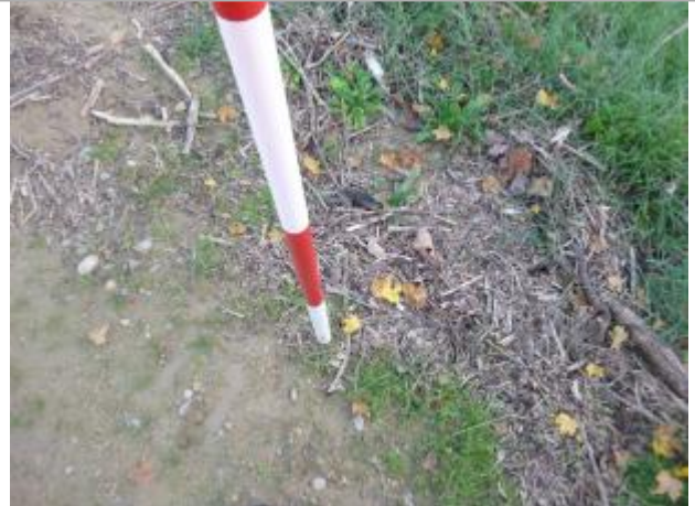
Berge rive gauche vigne