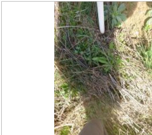
Berge rive gauche champ

Coordonnées WGS84 : X: 2.31306276 / Y: 43.10443900