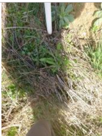
Berge rive gauche champ