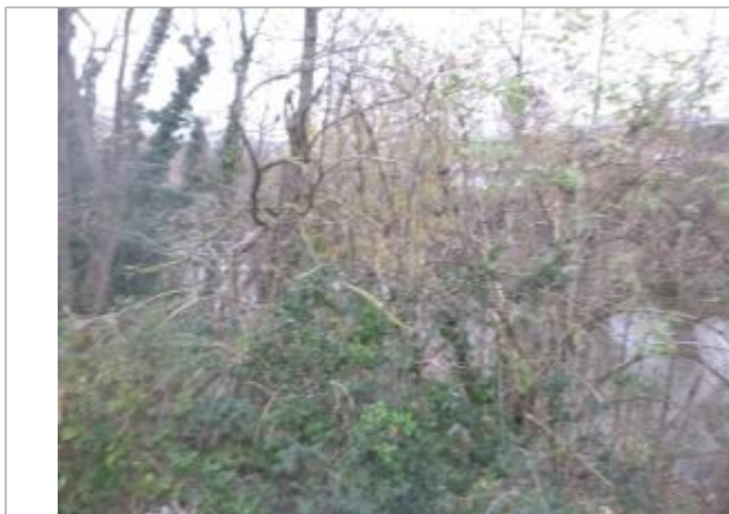
Berge rive gauche

Coordonnées WGS84 : X: 2.24501944 / Y: 43.04053650