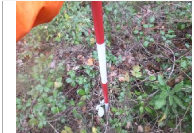
Berge rive gauche forêt

Coordonnées WGS84 : X: 2.26128058 / Y: 42.98981540