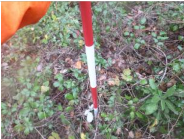
Berge rive gauche forêt

Altitude calculée de l'eau (en m) : 203.02