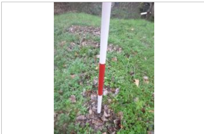
Berge rive droite amont