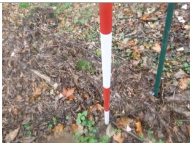
Berge rive droite