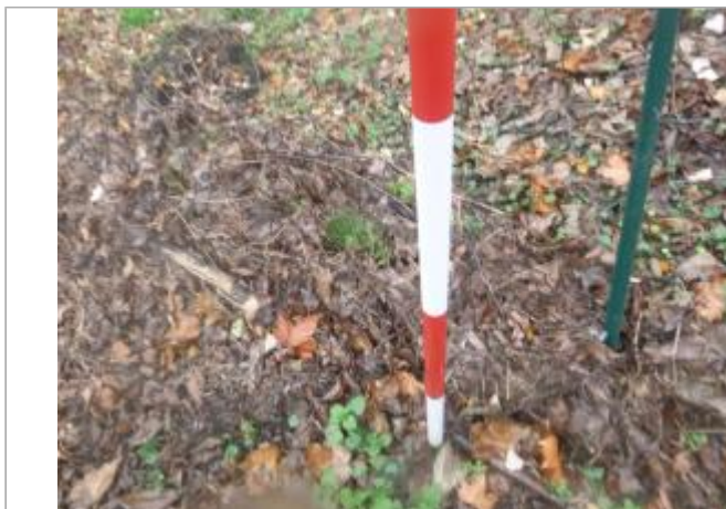
Berge rive droite

Coordonnées WGS84 : X: 2.26046658 / Y: 42.99208750