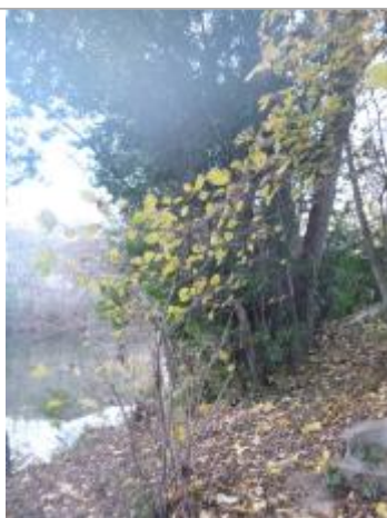
Berge rive droite forêt amont